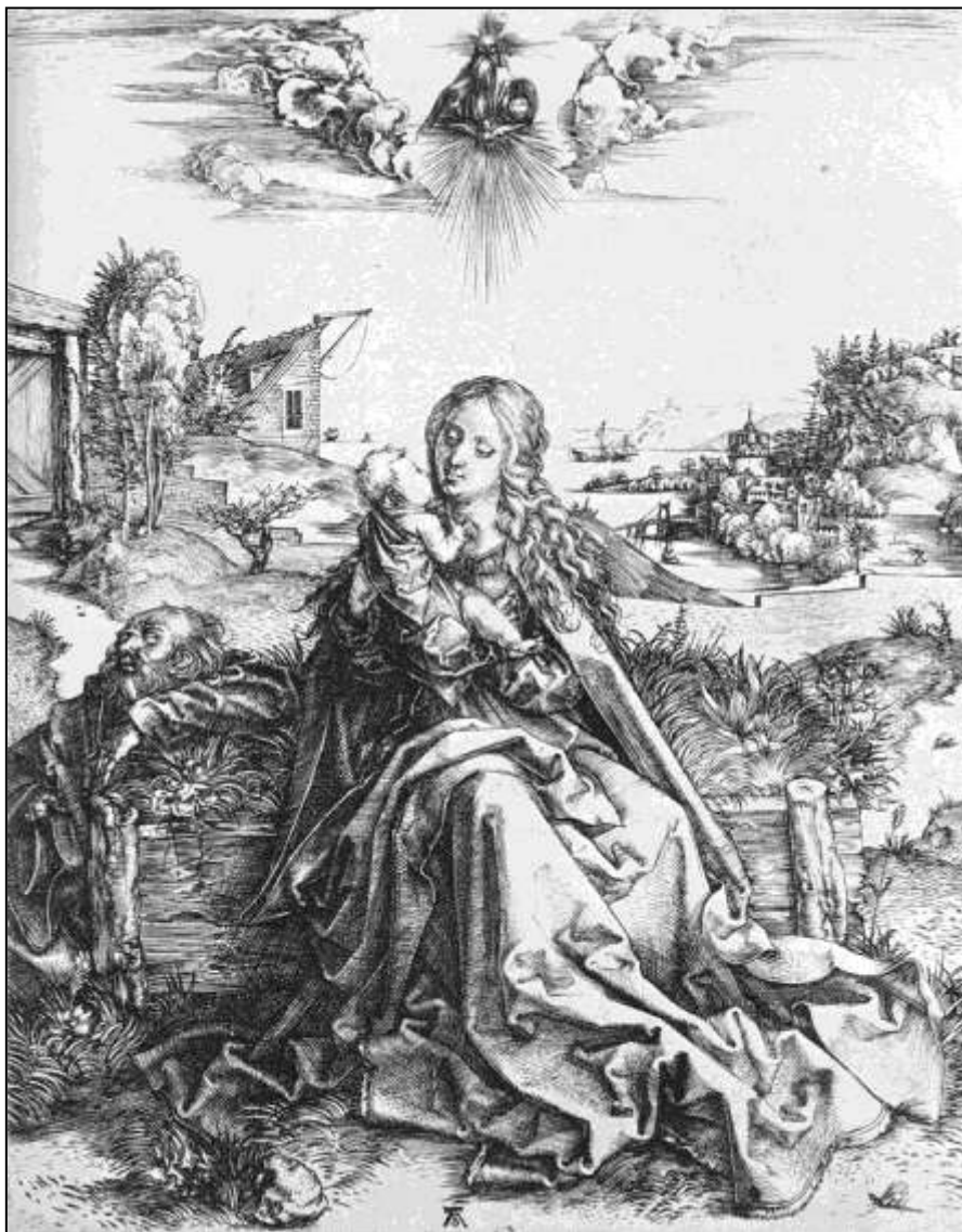
Albrecht Dürer: Madonna s Ježišom (1510-1520)